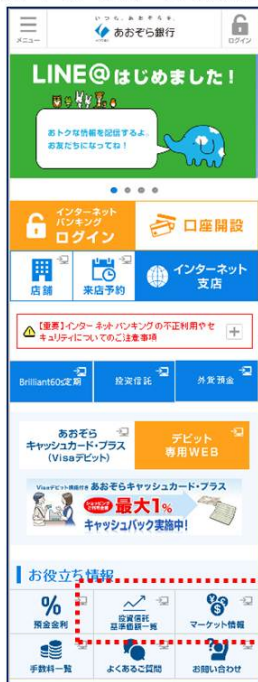
① トップページ（スマートフォン用画面）