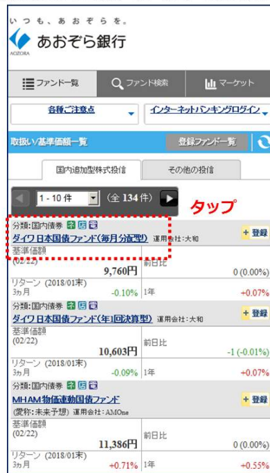
② 投資信託基準価額一覧（スマートフォン用画面）