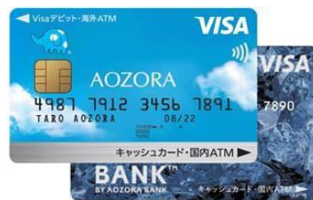
あおぞらキャッシュカード・プラス