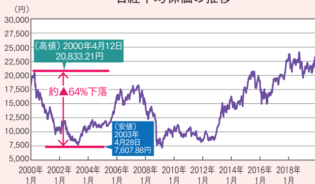
日経平均株価の推移