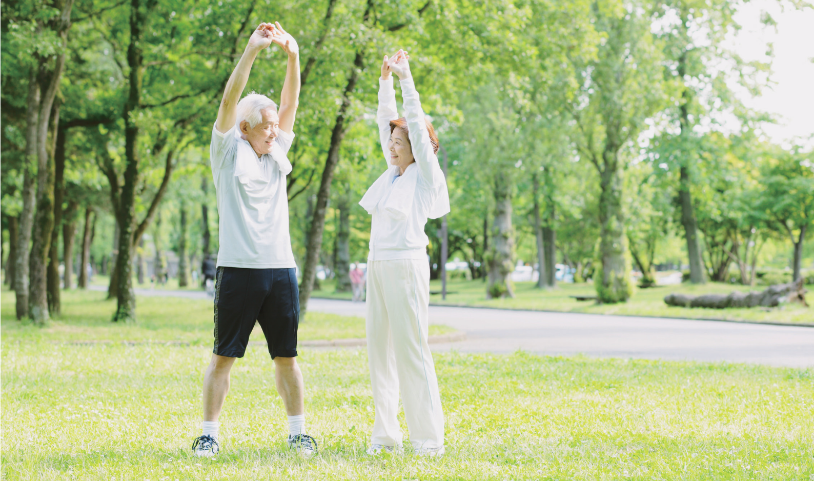
※上記写真はイメージです